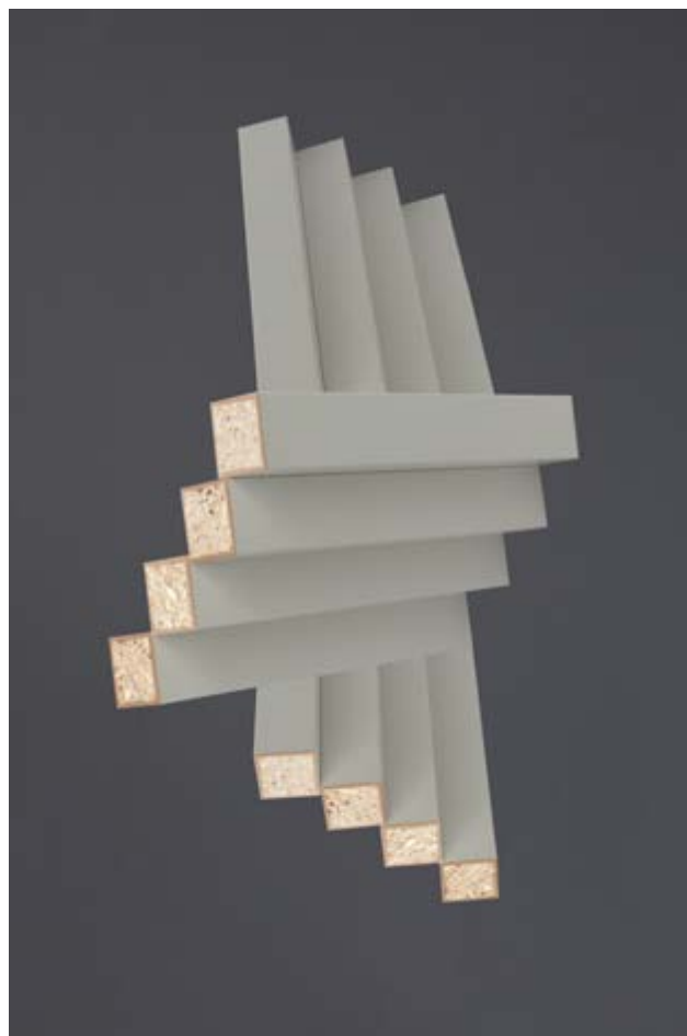
Recomposition II, 15