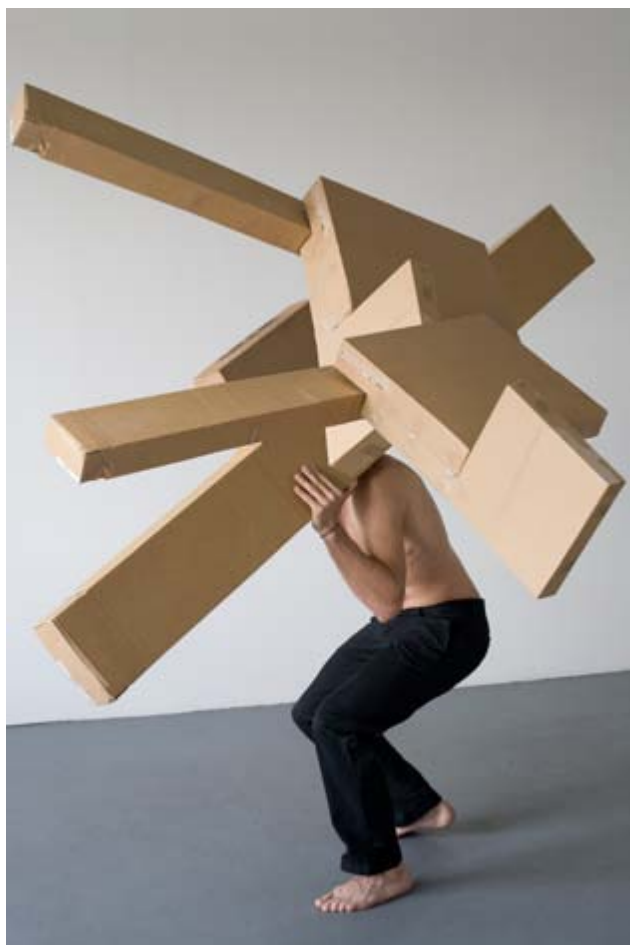
Recomposition I, 01